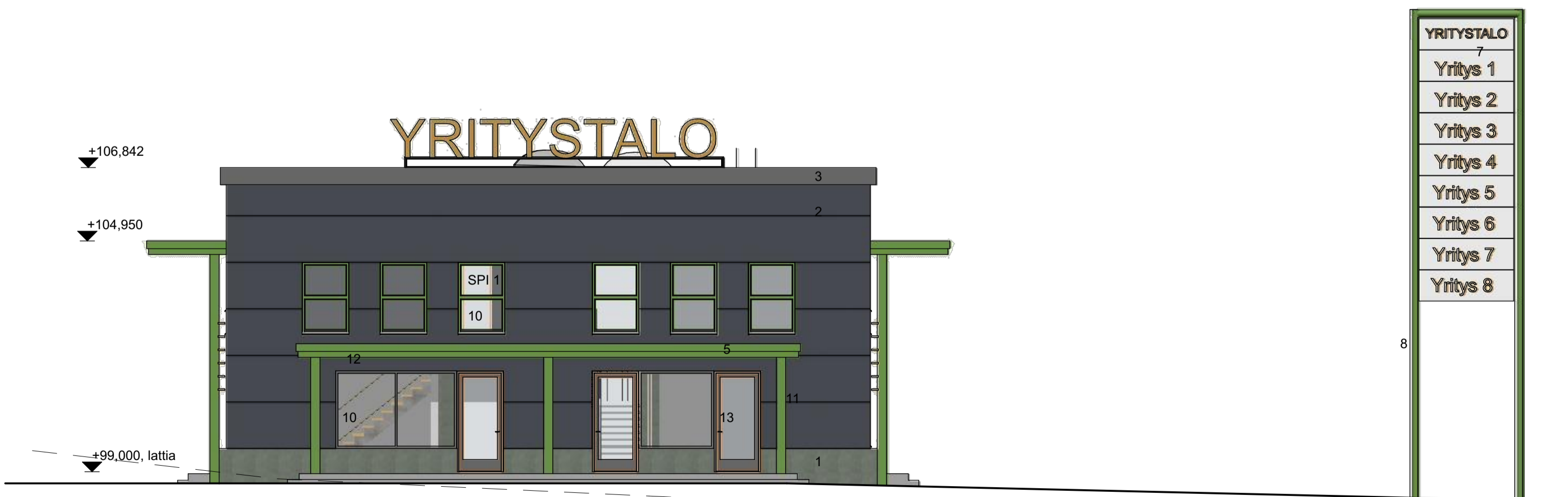
JS-P Julkisivu pohjoiseen 1:100