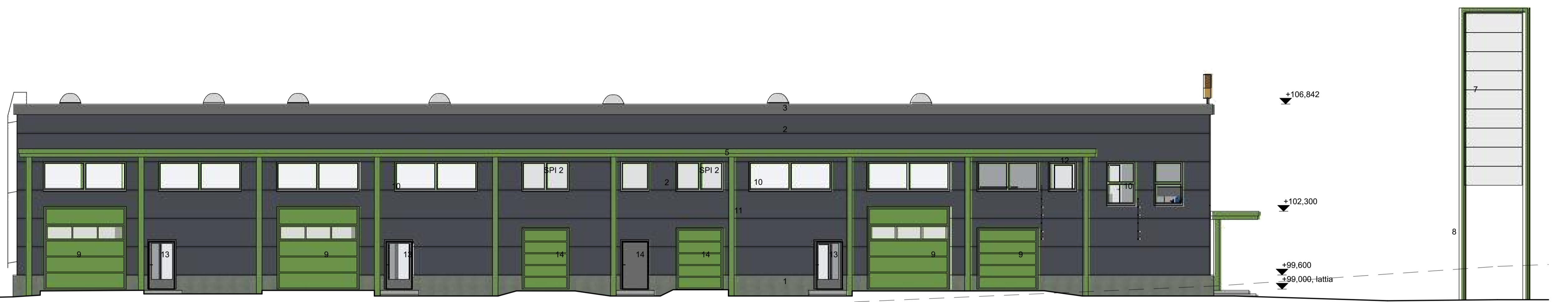
JS-I Julkisivu itään 1:100