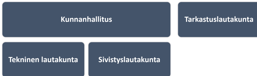
Kuvio 1: Kunnan toimielimet ja niiden johtosuhteet

Kunnan toimielimiin kuuluvat lisäksi riippumattomat vaalitoimielimet sekä seuraavat yhteiset lautakunnat: